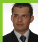
Michal Baginski (PM)